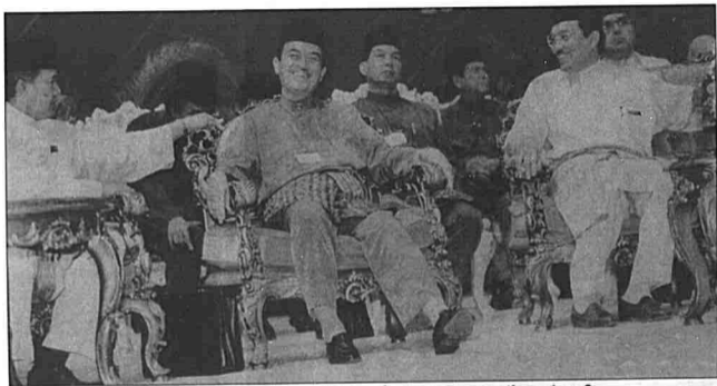
Seronok nampak Pak Lah duduk di tengah-tengah. Siapa yang raikan siapa?