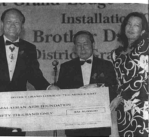
Marina Mahathir dalam satu majlis anjuran Freemason.